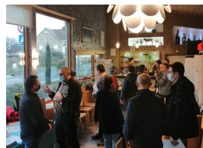
Moment convivial pour finir le café transmission en Alsace (67)