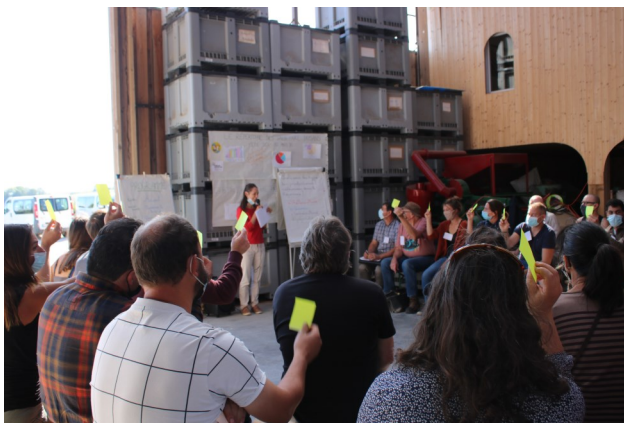
C'est le temps du quizz à la fête du Répertoire (Meuse)

15 nouvelles fiches témoignages vont être publiées prochainement. Vous pourrez découvrir entre autres les témoignages d'une éleveuse de chèvre angora, de producteurs de semences paysannes, ou encore d'un arboriculteur installé en collectif.