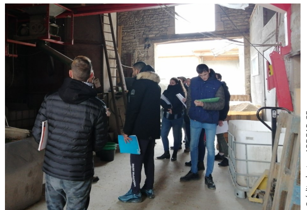
Les élèves du lycée agricole La Barotte écoutent attentivement Gilles (Haute-Marne)